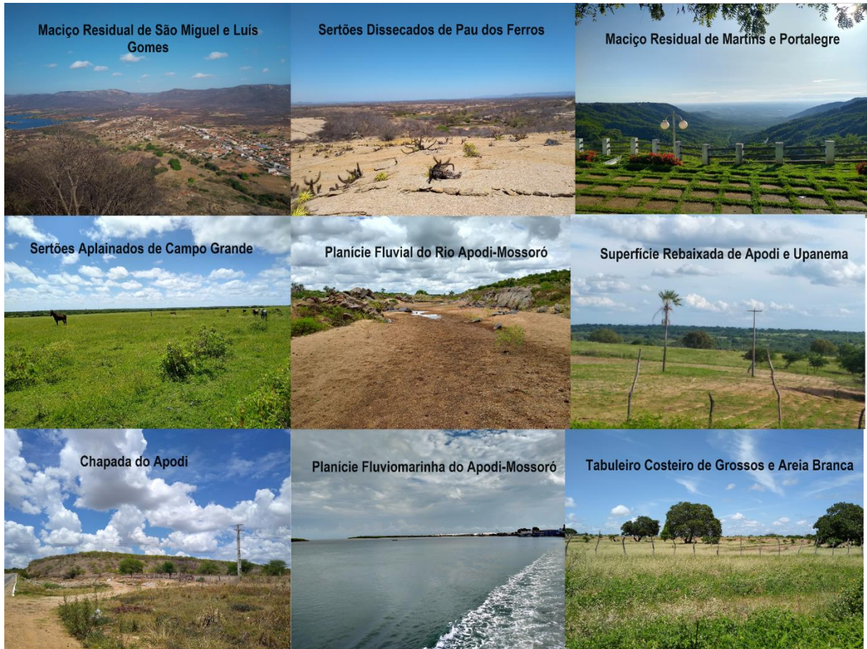
Figura 2: Cenários paisagísticos dos sistemas ambientais da bacia hidrográfica do rio Apodi-Mossoró.