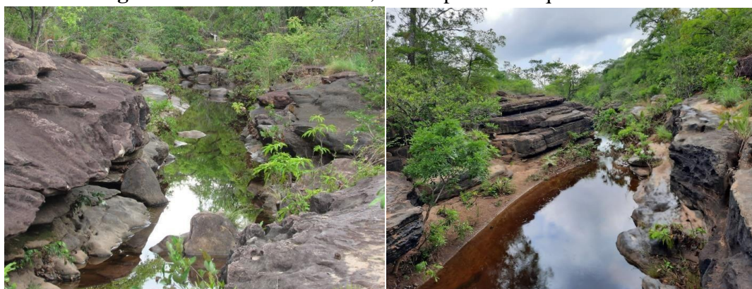
Figura 3: Riacho da Curicaca, município de Tanque do Piauí

Destaca-se que estes riachos podem ser caracterizados como canais de drenagem bem encaixados. As rochas que formam pequenas paredes ao longo do riacho são arenitos bem intemperizados, dando origem a leitos rochosos. Por se tratar de um vale bem encaixado, caracterizando um pequeno cânion em formação, é possível perceber que o percurso do riacho vai se alargando, possibilitando banhos ao longo do seu percurso.