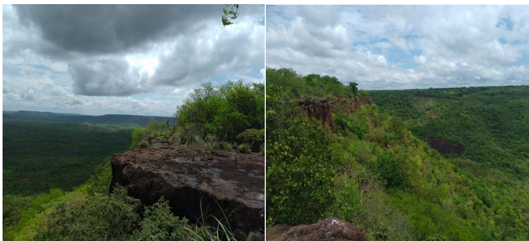
Figura 7: Talhado do Cantinho, município de Tanque do Piauí

Situado na zona rural do município, com acesso por estrada de chão batido, a aproximadamente 10km da sede do município, altitude de 404 m, coordenada 79°85'45" e 92°62'470", o Talhado do Cantinho (Figura 7) é bastante conhecido pelos moradores, devido a sua beleza estética, podendo ser desenvolvido atividades turísticas, pedagógicas, como também científica.