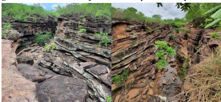
Figura 5: Cânion do Brejinho, município de Tanque do Piauí.

Turisticamente, o local dispõe do riacho do Brejinho, com destaques para os seus grandes paredões rochosos. Por falta de investimentos, o local é pouco conhecido no município e na região, onde o mesmo tem potencial turístico e científico, podendo também ser desenvolvido trilhas no local.