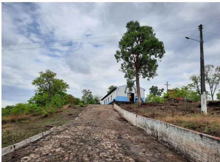
Figura 4: Igreja Nossa Senhora da conceição, município de Tanque do Piauí.

Durante todo o ano a comunidade permanece com um fluxo bem reduzido de pessoas, mas no período da Romaria ocorre esta migração, onde são construídas pequenas barracas comerciais, bem como casas são construídas, reformadas e habitadas.