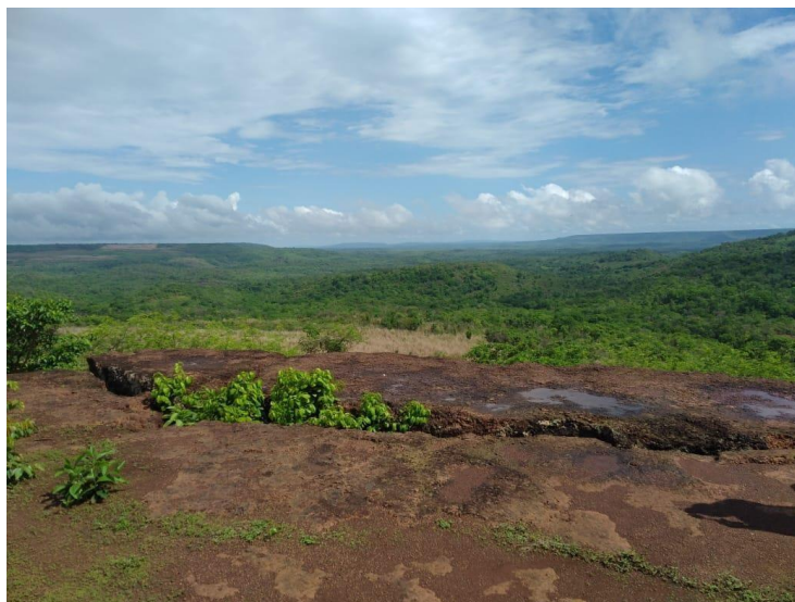
Figura 6: Pedra rachada, Município de Tanque do Piauí