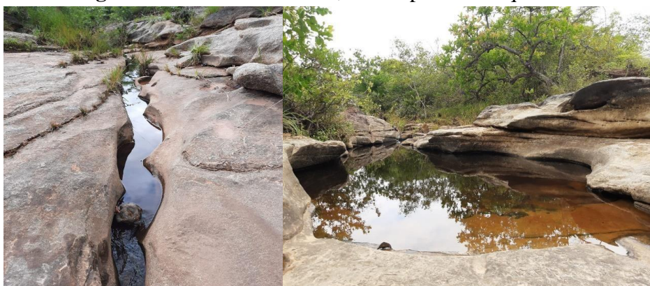
Figura 2: Riacho do Salobro, município de Tanque do Piauí.

Trata-se de um afloramento de arenito, com a presença de óxido de ferro nas áreas adjacentes, sendo mais perceptível pela tonalidade da água ser mais escura, produto da matéria orgânica carregada. O Riacho possui leito rochoso e bem encaixado, ou seja, forma um vale em forma de “V”, trazendo as características de um cânion iniciando sua formação.